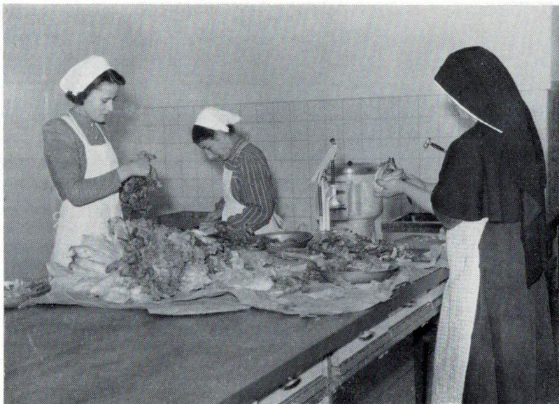
Die dienenden Geister

guten Kellerräume wegen, die so gewonnen werden konnten, wurde beschlossen auszugraben. So begann der Bagger mit einem Monat Verspätung im Sommer 1955 ein Riesenloch auszuheben, nachdem die Nordecke des Konviktes durch eine starke Stützmauer gesichert worden war. Dann wurde ein fahrbarer Kran aufgestellt, ein Zementsilo installiert, Holz herbeigefahren und Röhren und Eisen aufgeschichtet. Den ganzen Tag beinahe fraß sich die Fräse in die Bretter und Balken, um die Einschaltungen anzupassen. Das war ein Sausen und Rattern, ein Rollen und Knattern das ganze Sommertrimester hindurch, daß sich die Maturanden beinahe noch für die Matura entschuldigen wollten. Aber der Rohbau wuchs programmgemäß aus dem Boden. Starke Grundmauern umfassen die Räume des untersten Kellers für Obst, Kartoffeln, Gemüse und Trinkbares. Darüber erhebt sich die geräumige Küche mit dem notwendigen Luftschutzraum und einem Eßzimmer für die männlichen Angestellten. Dann beginnt der eigentliche Hochbau. Zuerst der Speise-